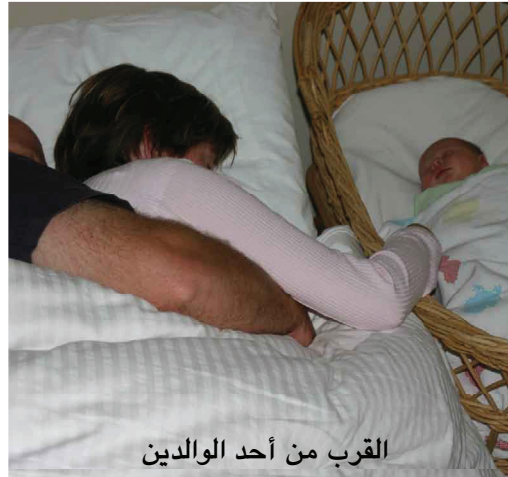
القرب من أحد الوالدين