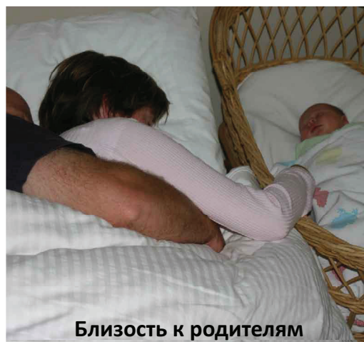
Близость к родителям