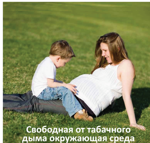
Свободная от табачного дыма окружающая среда