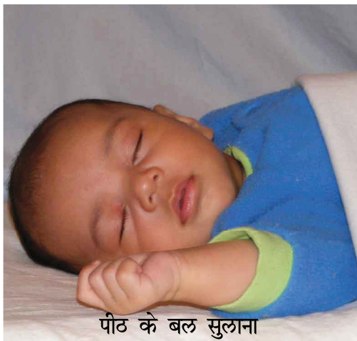
पीठ के बल सुलाना