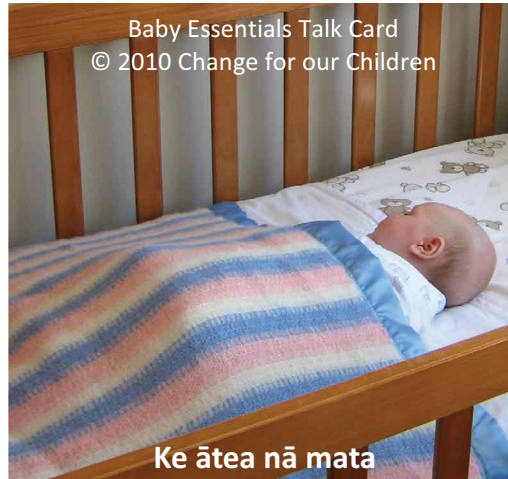
Ke ātea nā mata