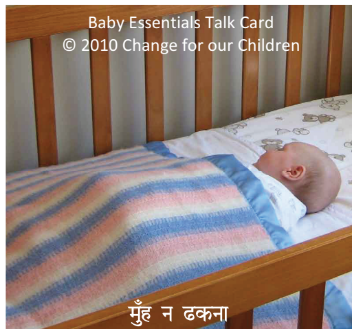
मुँह न ढकना