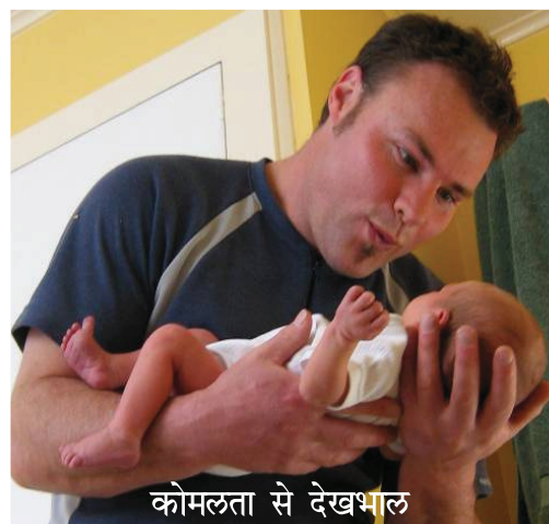
कोमलता से देखभाल