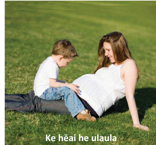
Ke hēai he ulaula