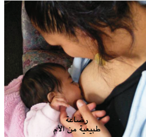
رضاعة طبيعية من الأم