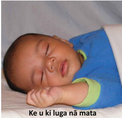
Ke u ki luga nā mata