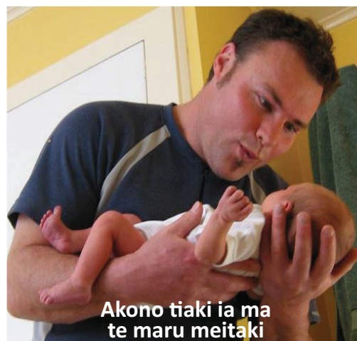
Akono tiaki ia ma te maru meitaki