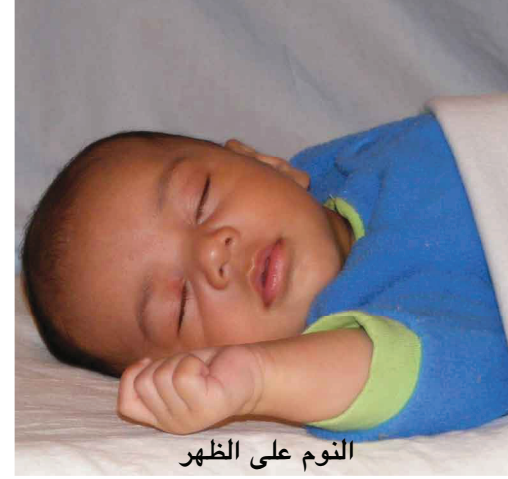
النوم على الظهر