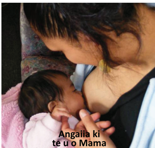
Angaiia ki te u o Mama