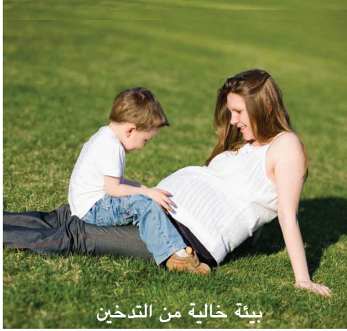
بيئة خالية من التدخين