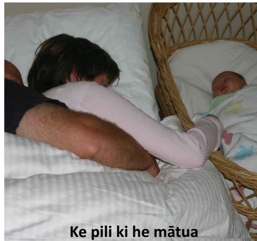
Ke pili ki he mātua