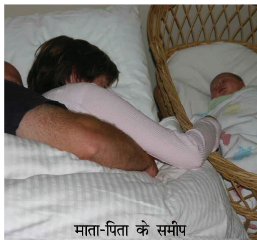
माता-पिता के समीप