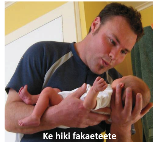
Ke hiki fakaeteete