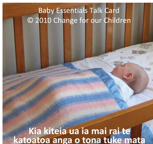
Kia kiteia ua ia mai rai te katoatoa anga o tona tuke mata