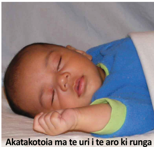
Akatakotoia ma te uri i te aro ki runga