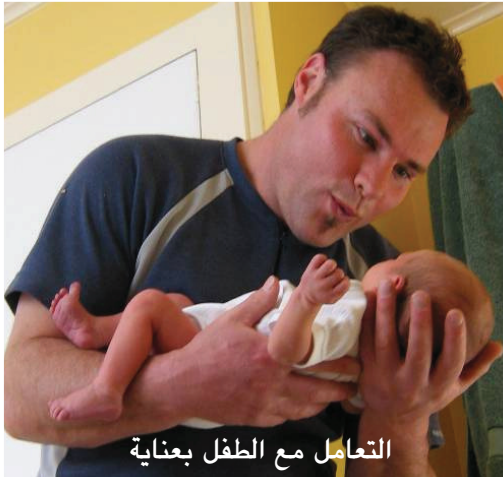
التعامل مع الطفل بعناية