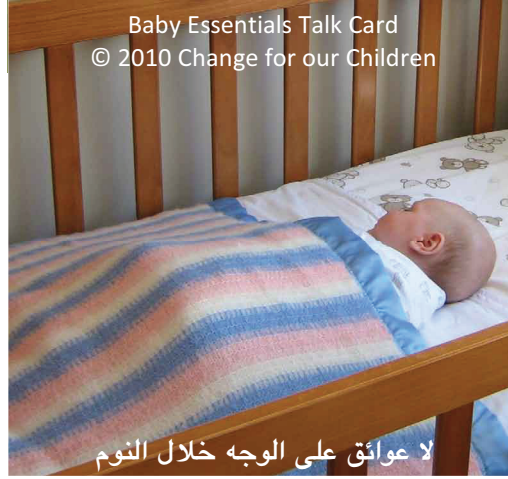
Baby Essentials Talk Card © 2010 Change for our Children