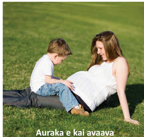
Auraka e kai avaava