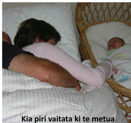
Kia piri vaitata ki te metua